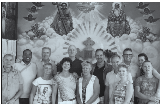
De Ethiopiëgroep 2017 in de Parochiekerk van Abba Kebede in Wolisso.

De uitstelling van het Allerheiligste vindt plaats elke eerste vrijdag van de maand in de Laurentiuskerk van 13.30 tot 15.30 uur.