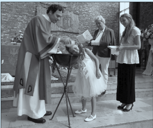
"Het doopsel is eigenlijk het mooiste en beste geschenk dat je je kind mee kunt geven."